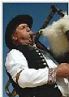
„Poleński Osop” w Kotleńsku zapodczył tegoroczne „Jotrzańskie Włci”. – str. 13