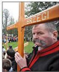
Podhalanie w obronie krzyża - str. 3

UKAZUJE SIĘ NA PODHALU, ORAWIE, SPISZU, W CHICAGO I TORONTO