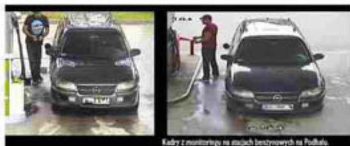
Każdy z monitoringu na stacjach benzynowych na Podhalu.

Ukrywa się pod czerwoną czapką, jeździ oplem omegą i na potęgę okrada stacje benzynowe w okolicach Zakopanego.