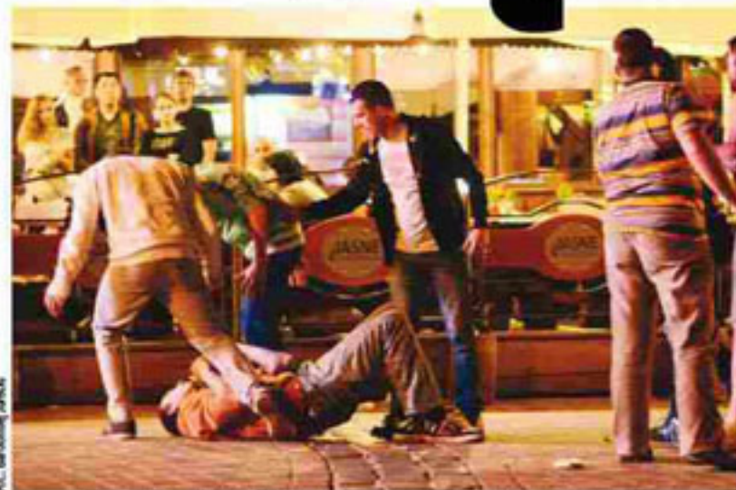
Sobota, godz. 7 w nocy. Na Krupówkach wybuch awantury, która zamieniła się w bójkę. Podobne sceny rozgrywają się tu w każdy weekend.