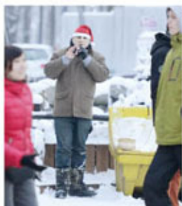
Na Krupówkach tłum turystów. Mało kto zwraca uwagę na naszego gracza.