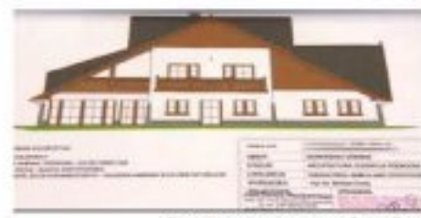
Projekt schroniska wykonany przez Barbarę Dunaj