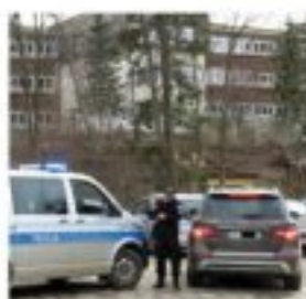
Policja szybko zatrzymała sprawców napadu.