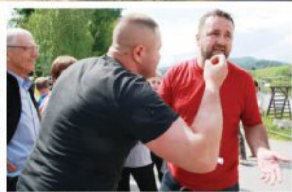
Transakcja Morawca, inwestora Tropicana Beach, nie przekonują mieszkańców Kluszkowców.