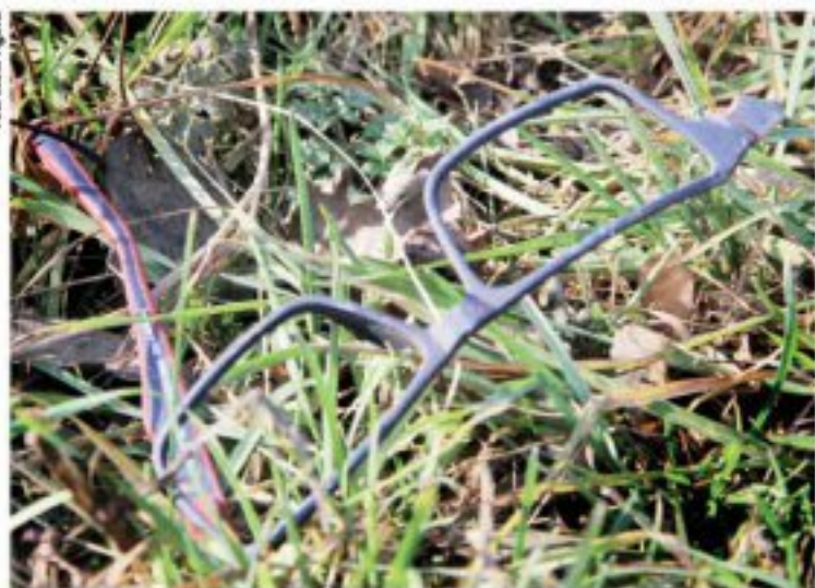
Jeden z niedziwnych śladów sobotniej tragedii.