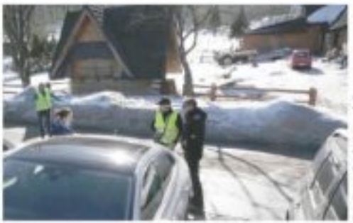
Jeden parkingowy wskazuje kierowcom miejsce, inny pobiera opłatę, nie informując o tym, że można ją uścić w parkometrze za niższą stawkę.