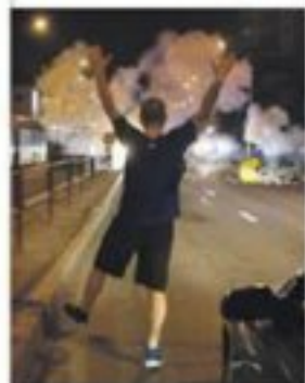
Jedno z ostatnich zdjęć zrobionych przed aresztowaniem przez Witolda Dobrowolskiego.