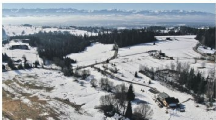
Detalaj mieszkańcom to miejsce koczowało się głównie z wiosennymi krokusami. Teraz wszystko ma się zmienić.

- Będziemy protestować, blokować, nie ma naszej zgody na ten maszt - mieszkańcy jednego z najbardziej urokliwych osiedli Nowego Targu nigdy nie byli tak solidarni.