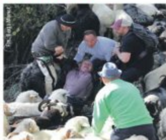
Trzeba było odciągnąć młodszą w bezpieczne miejsce.

Nic nie wskazywało na to, że redakcja w Ochotnicy może mieć tak dramatyczny przebieg. To trwało sekundy. Pan Franciszek doskonale znalazł pod owcami. Drogi kuzin, który zachował zimną krew, wszyscy skoczyli się szczytliwie.