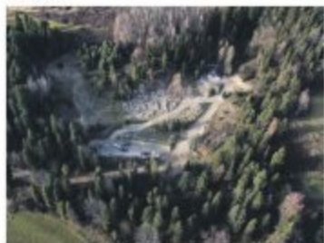
Wiel jest podziwiona, G, którzy jedzą na motocyklach trialowców są zawodowcy, innym to przeszkadza.

Na granicy Harklowej i Knurowa powstaje miejsce do treningu dla trialowców. - To skalniak - twierdzi właściciel.