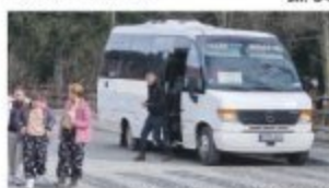
Postój dla busarzy przy parkingu na Palenicy.