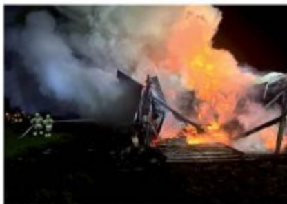
Białka Tatrzańska. 27 kwietnia godz. 1.53. Strażacy walczą z ogniem. Kłosał popalił stertę drewna.

27 kwietnia o godz. 1.53 w nocy do Ochotniczej Straży Pożarnej w Białce Tatrzańskiej dociera informacja, że u stóp Kotelnicy w Białce Tatrzańskiej jest pożar. Strażacy są na miejscu już kilka minut później. Jak się okazuje płonie ogromna sterta drewna na placu, brzozy, deski. Około 15 kubków Mirno strażackich stało, niestety ogniem jest tak duży, że niczego się już tu uratować nie da. Sposób, w jaki całość zajęta została, przez ogień, wskazuje na to, że to podpalenie. Sprawa trafia na policję. Kryminalni próbują ustalić, kto stoi za podpaleniem. Nieoficjalnie dowiadujemy się, że szybko udaje im się zdobyć film z monitoringu,