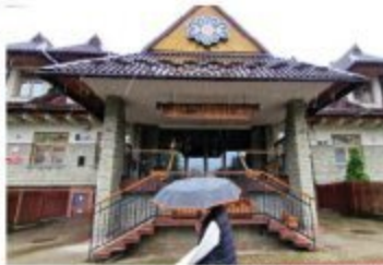
Perłownik Parzenica w Zakopanem.

Parzenica i Złoty Róg w niejasnych okolicznościach zmieniły właściciela. Wyprawdazanie majątku znany w Zakopanem, ale z lat 90.