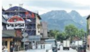
Zakopane, ul. Nowotarska