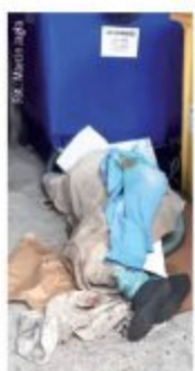
Bezdomni od kilku miesięcy lipi w osiedlowych brzoziakach.

Idzie zima. Co z bezdomnymi w Nowym Targu?