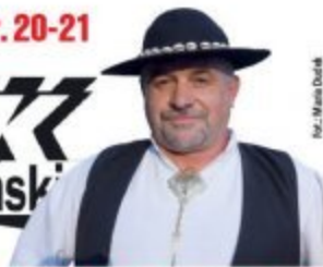
Gazda Roku z Waksmundu str. 19